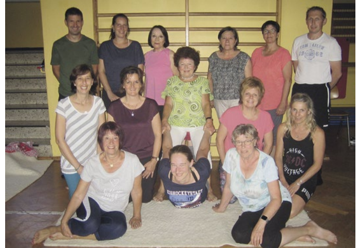
Kurs Limbach, Dienstag

Kursort: Grundschule Laudenberg Schulturnhalle, Einbacher Straße.