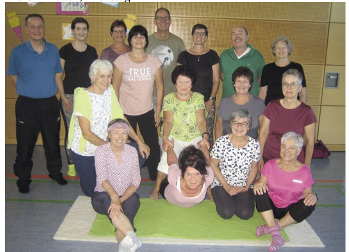
Kurs Fahrenbach, Donnerstag 18 Uhr