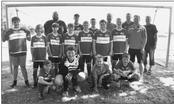
SV DIANA Limbach 1933 e.V.