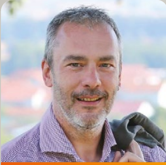
Jens Wittmann (47) Bürgermeister und Kreisrat

6 Stimmen für eine starke Vertretung im Kreis