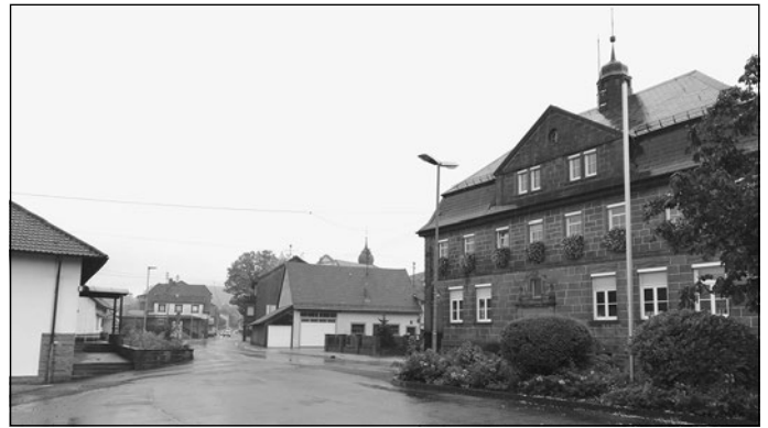
Das gesamtörtliche Entwicklungskonzept dient als Grundlage für weitere Maßnahmen im Sanierungsgebiet in Limbach. Das Gebiet erstreckt sich im historischen Ortskern. Eine mögliche Maßnahme könnte die Verlagerung des Bauhofs sein.

Als letzter Tagespunkt auf der Liste, stimmte der Gemeinderat notwendigen Befreiungen von insgesamt sieben Bauvorhaben in der Gemeinde zu. Darunter sind vier Einfamilienhäuser, zwei Garagenerweiterungen und ein gewerblich genutzter Neubau.