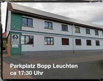
Parkplatz Bopp Leuchten ca 17:30 Uhr

Bei schlechtem Wetter findet das Wanderkonzert nicht statt!