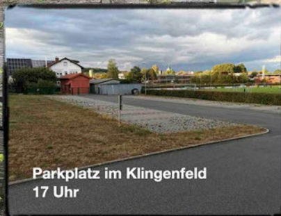
Parkplatz im Klingefeld 17 Uhr