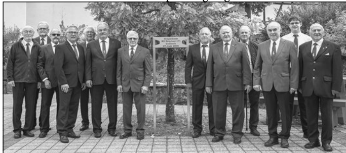
Auf dem Bild fehlen folgende Sänger: Klaus Baier, Valentin Kern, Willi Schäfer