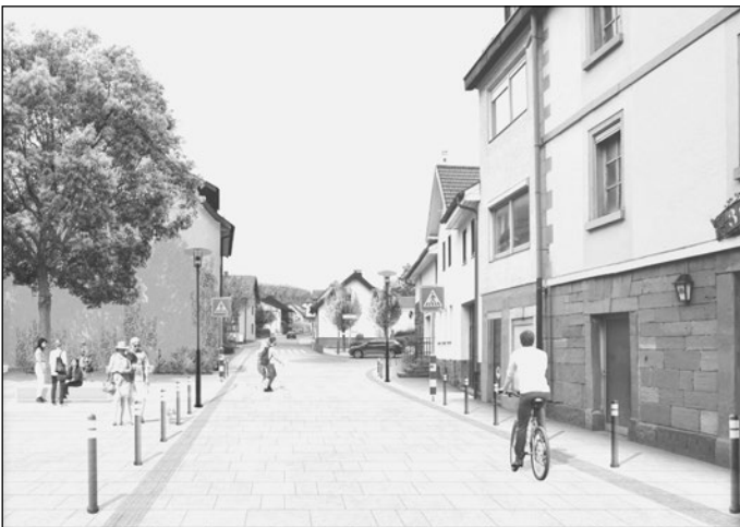
Die Bilder zeigen die aktuelle und die Vision einer künftigen Limbacher Ortsmitte.