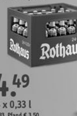
Rothaus Pils Tannenzäpfle.