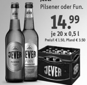
Jever Pilsener oder Fun.