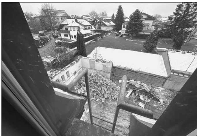
Die Bilder geben einen Eindruck von den aktuell laufenden Abrissarbeiten im Vorfeld der Baumaßnahmen am Rathaus.