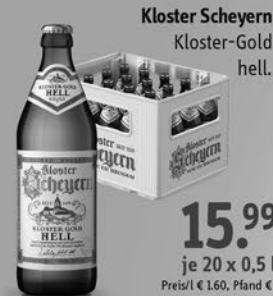
Kloster Scheyern Kloster-Gold hell.