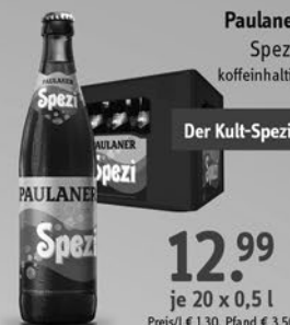
Paulaner Spezi. koffeinhaltig