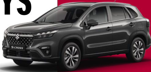
Abbildung zeigt aufpreispflichtige Sonderausstattung.

Am 25. und 26.3. von 10 bis 18 Uhr bei uns! Angebote, die perfekt ins Leben passen.