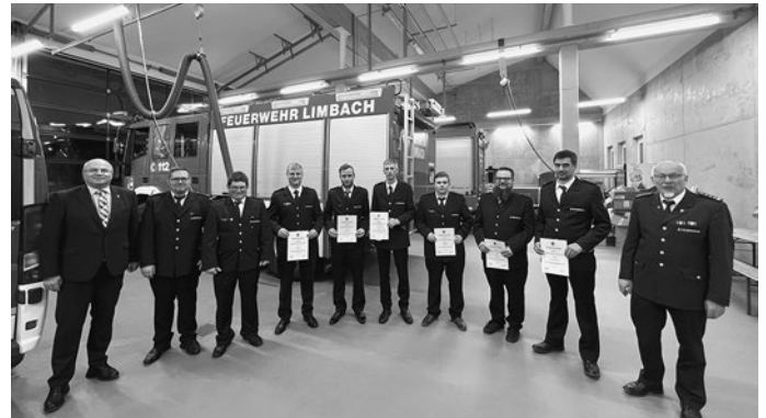
Die Beförderten und Neuzugänge